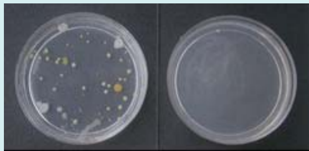
噴霧前 / 細菌 噴霧後 / 細菌 安定化二酸化塩素による空気中の細菌削減試験

(細菌用プレート Nutrient Agar 培地を使用 / 開放時間は 20 分 / プレートは 37℃で 24 時間 培養した) (試験場所により結果は異なります)